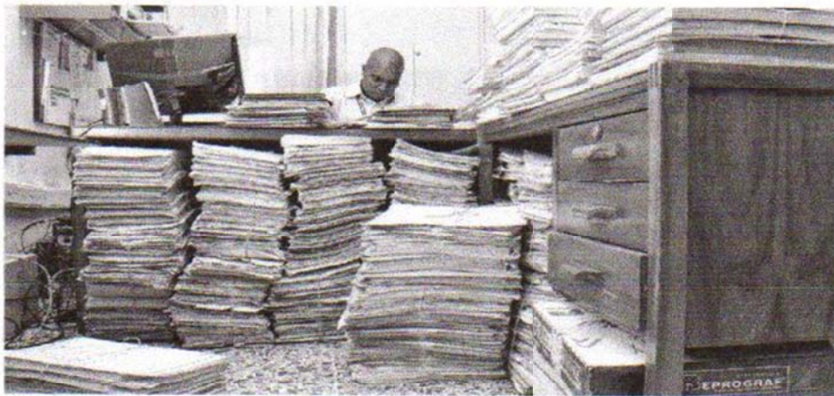
Procesos. En una oficina pequeña, ubicada en Imbabaco, reposan cientos de expedientes de casi un metro de altura. Se trata de casos en los que se exponen presuntos errores médicos. Cada proceso tiene cinco años para ser analizado y fallado.

En la oficina del Tribunal de Ética Médica del Valle del Cauca, ubicada en la Calle No. 18D-153, hay más de 600 carpetas apiladas. Los arrumes superan el metro de altura. Todas cuentan la historia de un paciente que consideró que en su proceso de atención se comió un error médico.