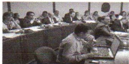
Debate. En comisión del Concejo, los miembros del Cabildo Municipal han sustentado los ejes del plan de desarrollo.

9,3 millones de pesos cuesta la ejecución de los programas del plan de desarrollo.